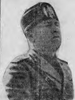
MUSSOLINI La "blitzkrieg" en Africa LA SEGURIDAD DE LAS NACIONES

Hasta hace poco tiempo había en el mundo una especie de mandato de conciencia que ordenaba a los hombres, a los gobiernos y a los pueblos respetar a las naciones como se respetan las cosas ajenas o la mujer del prójimo.