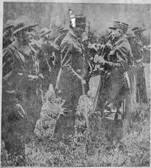
El general Weygand, jefe del ejército francés (derecha) felicitando al general Dehattré, que mandó la décima cuarta división en las últimas semanas de la guerra en territorio de Francia. Tropas de esa división desfilaron en columna de honor ante sus jefes en los campos de Clermont Ferrand