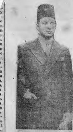
REY FAROUK DE EGIPTO SOMALIA BRITANICA

mera clase e instruido a la europea. El país tiene una extensión de 994 mil kilómetros cuadrados y su población es de más de 15 millones de habitantes. El ejército de línea llega a 350.000 hombres con reservas instruidas que suman 1.780.000 soldados. Egipto, en árabe MISR, es un reino independiente aliado de la Gran Bretaña con la que tiene intereses comunes en el canal de Suez y en el Sudán que es anglo-egipcio, colonizado y administrado por las dos naciones conjuntamente.