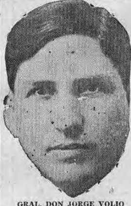
GRAL. DON JORGE VOLIO

SERAN SOMETIDOS TAMBIEN ALGUNOS OTROS DE IMPORTANCIA Como es sabido en la semana próxima se completa el período de las sesiones ordinarias del congreso. Se están celebrando dos sesiones diarias para así tramitar los diversos proyectos que están pen-