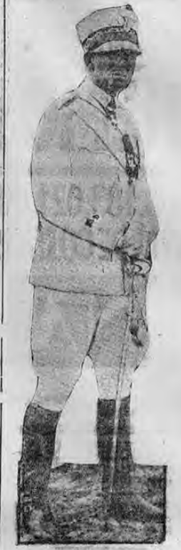
MARISCAL GRAZZIANI Generalísimo en Libia

Desde Abisinia y Eritrea, así como desde la Somalia italiana, los ejércitos del Duce han emprendido el ataque contra la Somalia inglesa. Se trata de una guerra secundaria que podríamos decir al contemplar las operaciones entre ambas naciones y sus teatros de lucha. En el confin del continente africano que a la salida del mar rojo avanza sobre el océano Índico está el establecimiento de la Somalia británica. Es un territorio poco conocido de unos 150 mil kilómetros cuadrados poblado por unos 270 mil seres humanos.